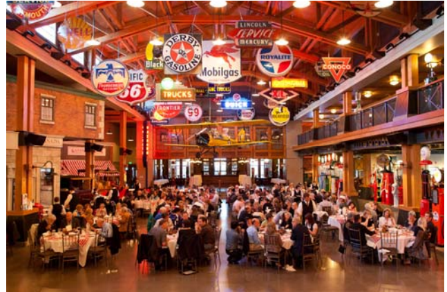
Dîner et soirée de remise des prix à Heritage Park