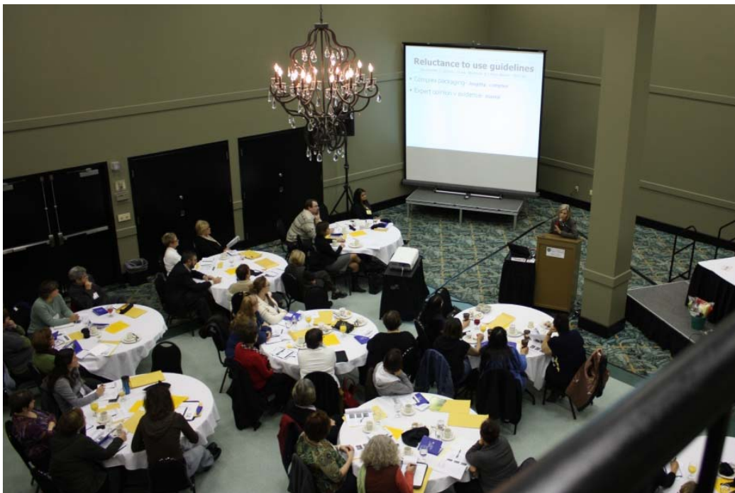
Congrès sur la douleur de 2010, à Moose Jaw, en Saskatchewan

Outre les activités citées plus haut, un congrès ayant pour thème la formation interprofessionnelle sur la prise en charge de la douleur a été tenu à Regina en janvier 2011. Cette activité d'un jour et demi a attiré 120 étudiants et professeurs de l'Université de Regina et de l'Université de la Saskatchewan. Ces étudiants en psychologie, en travail social, en kinésiologie, en études de la santé, en physiothérapie, en pharmacie, en médecine et en soins infirmiers ont participé aux conférences et aux discussions de cas traitant de divers sujets liés à la douleur. Selon ces étudiants, le fait saillant du congrès a été le groupe de clients et la collaboration interprofessionnelle qui a transpiré dans les discussions de cas en petits groupes. On s'attend à ce que cette expérience se répète chaque année, dans un effort d'améliorer la pratique interprofessionnelle en matière de traitement de la douleur.